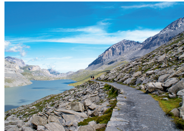
Karg – und wunderschön: die Landschaft am Daubensee.

tal, mehrmals müssen wir hier grosse Karstfelder überschreiten.